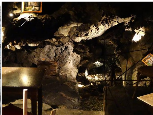
Подземието на ресторанта; р. Аменано