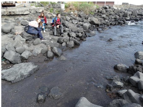
Изследване на вулканични скали