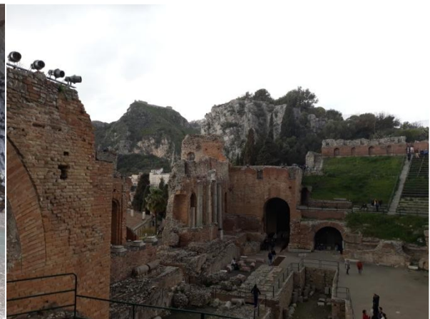
Античният театър в Таормина