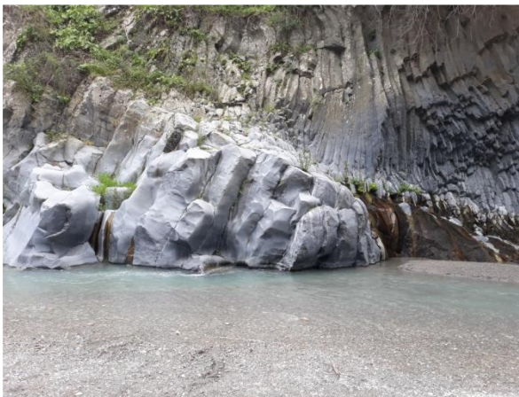
Ждрелото на р. Алкантара